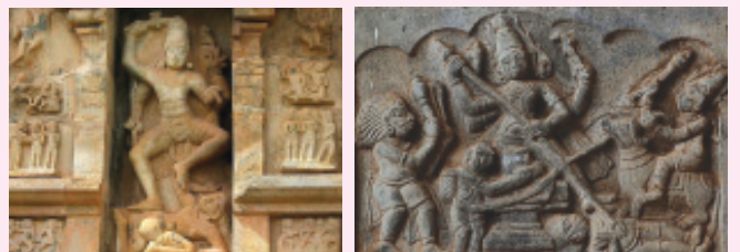
వివిధ క్షేత్రాల్లో కాలసంహారమూర్తి శిల్పాలు

ఆ ప్రయత్నంలో యమపాశం మార్కండేయునితో పాటు శివ లింగంపై కూడా పడింది. అచంచలమైన మార్కండేయుని భక్తివిశ్వాసాలకు పరవశించిన పరమశివుడు ప్రత్యక్షమై యముడిని సంహరించి,