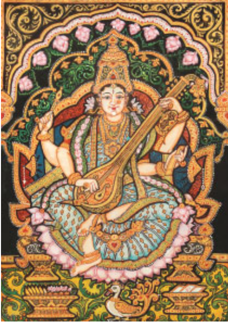
పద్మపత్ర విశాలాక్షి పద్మకేసర వర్ణిని నిత్యం పద్మాలయా దేవి సాహంపాతు సరస్వతి

సరస్వతీదేవిని అర్పించే పుష్పాల్లో ప్రస్తుతం మనం ఐదవ పుష్పమైన పొన్నపువ్వు గురించిన విషయాల గురించి తెలుసుకుందాం. పురాణాల్లో పొన్నచెట్టు ప్రస్తావన, వర్ణనలను మనం గమనించవచ్చు. దానికి పరిపాటిగానే ఇప్పుడు జరిపిన ఆధునిక అధ్యయనాల్లో సుమారు వందకు పైగా చిన్నా పెద్దా దేవాలయాల్లో పొన్న చెట్లు స్థల వృక్షాలుగా అలరారుతున్నట్లు వృక్షశాస్త్ర నిపుణులు చెబుతున్నారు. కొన్ని విశేషమైన పొన్న వృక్షాల గురించి ఇప్పుడు తెలుసుకుందాం.